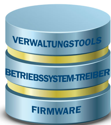
SMART STORAGE STACK